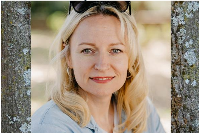
Erzieherin in der Flämmchengruppe, Waldpädagogin