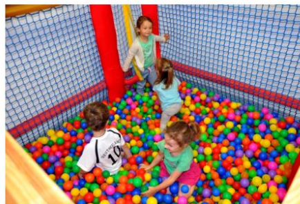
Bällebad im Gang