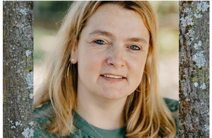
Erzieherin in der Erdmännchengruppe