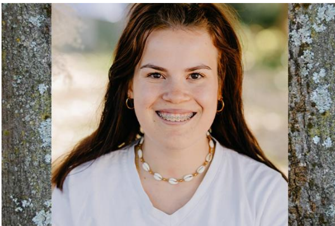
Erzieherin und Gruppenleitung in der Flämmchengruppe