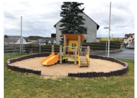
Spielgerät im Garten der Krippenkinder