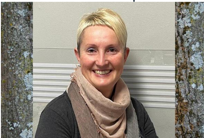
Büro und helfende Hand