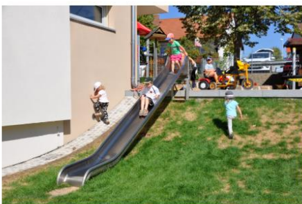
Rutsche im Garten