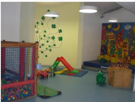
Bewegungsbereich im Gang mit Bällebad, Kletterwand, Fahrzeugen und verschiedenen Spiel- und Bewegungsmaterialien

Unter unseren großzügigen Räumlichkeiten befindet sich im Haus eine große Halle, welche wir bei Festlichkeiten und für die Bewegungserziehung nutzen.